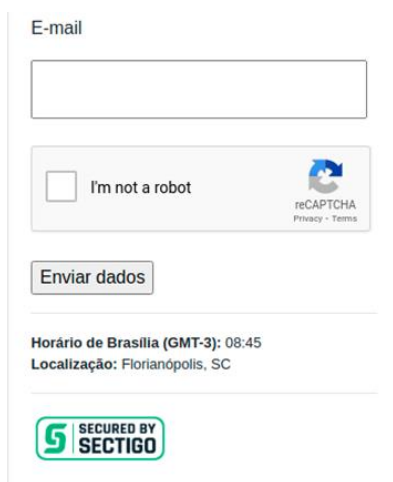
Figura 1 - Tela de acesso